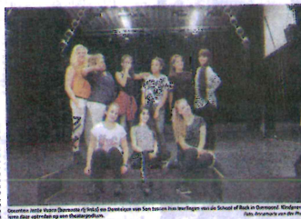
De leerlingen van de School of Rock tijdens een optreden op de Robert Kochlaats 342 in Ommoord-Oost.

School of Rock is haar tiende seizoen gestart. De lessen worden gegeven in het theater van het Gemeentelijk Centrum aan de Robert Kochlaats 342 in Ommoord-Oost.