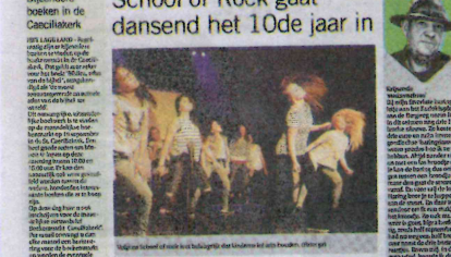
De leerlingen van de School of Rock tijdens een optreden op de Robert Kochlaats 342 in Ommoord-Oost.

De leerlingen van de School of Rock zijn hard aan de slag. Ze oefenen hun dansvaardigheden en zingen liedjes van bekende artiesten.